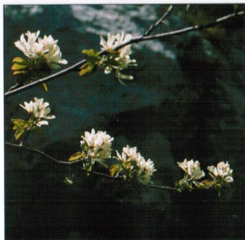
▲ ROTSMISPEL in bloei (bloeitijd in april).